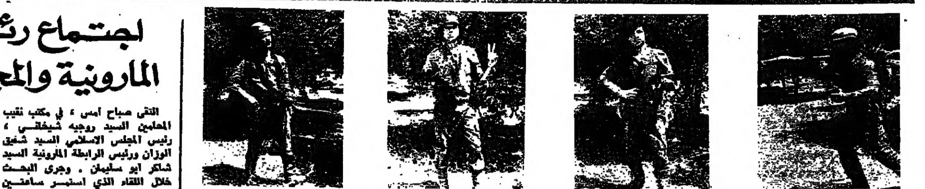
الشهيد الامام خالد ابراهيم

ولا يستغرب منها هذا المسمى الطيب في سبيل وحدة اللبنانيين . صراحة كاملة واضاف : لقد ساد هذا القمام صراحة كاملة وانفاق على ضرورة المباداة للمعالجة السريعة لتسيير تشغيل التوربينات على ان يستمر الحراير من اجل الطلب من هنا وهناك ، بما يزيل الشكوى ويرسي القواعد السليمة لإنهاء الأضرار التي ينعكس اليه الشعب ، وخاصة بلجيحة الطالعة .